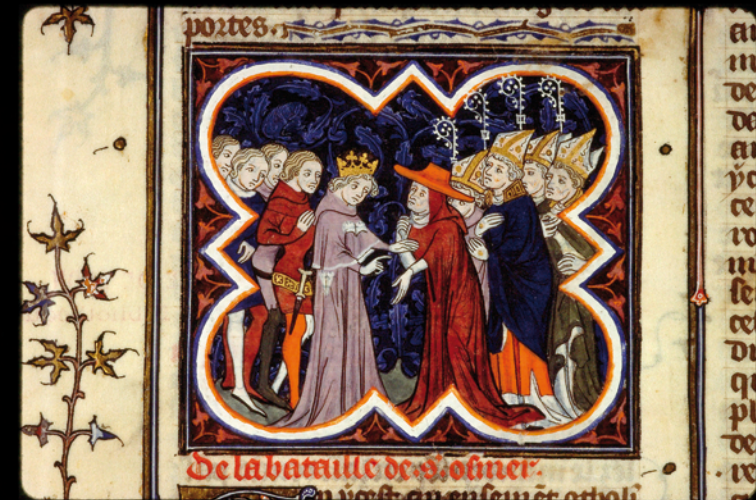
Philippe le Bel et le cardinal Lemoine, légat du pape (BM Lyon, ms 880, fol. 352v)