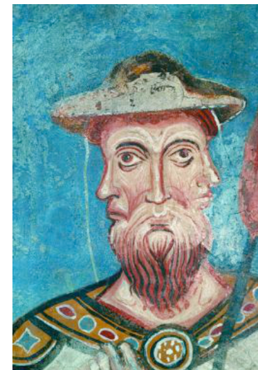
Détail des fresques de l' Anula Gotica (XIII e siècle) Rome, Basilica dei Santi Quattro Coronati

Vérité et crédibilité : la construction de la vérité dans le système de communication de la société occidentale (XIII e -XVII e siècle)